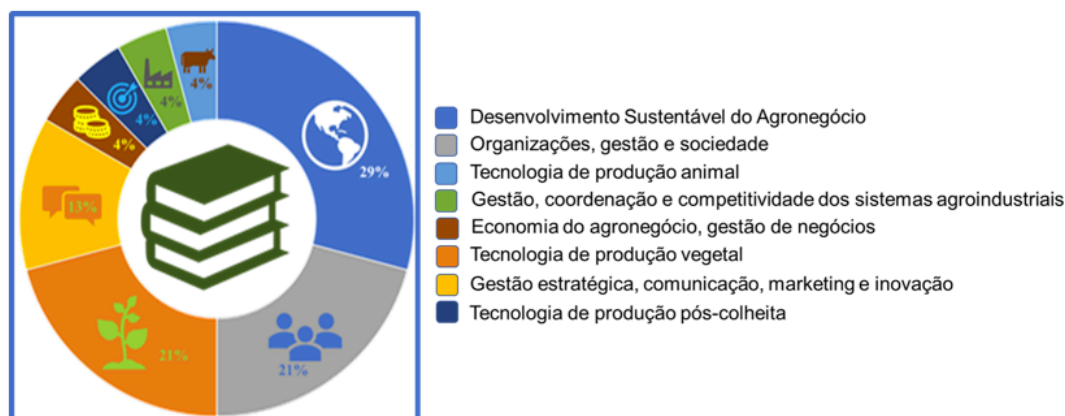
Gráfico 3. Índice de áreas de pesquisa da amostra.